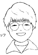
サイエンススタッフ かしはら

この時期の夜空は、春の星たちが見頃をむかえています。 まずは、北の空の「北斗七星」を探してみましょう。 7個の星がフライパンの形のように並んでいます。 フライパンの持ち手のカーブをのばしていくと、 うしかい座の「アークトゥルス」と、おとめ座の「スピカ」 の2個の星が見つかります。大きな三角形を作るように星を もう1個探してみると…少し西に、しし座の「デネボラ」。 この星図を見ながら春の星探しを 楽しんでみてくださいね！