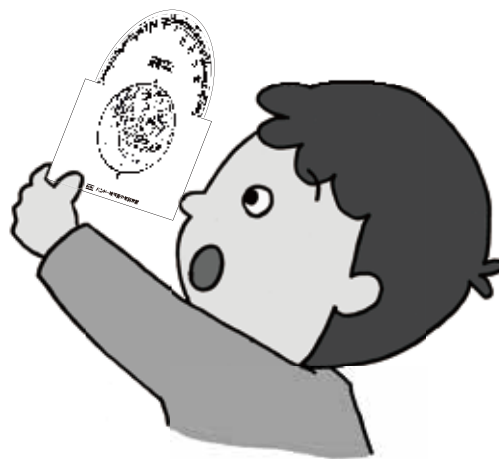
空にかざすため、東と西が逆になっているよ